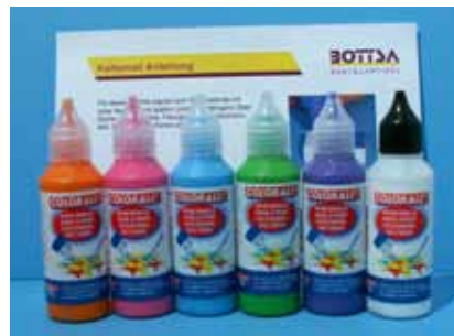
650 101 Set 1 / 6 Farben: weiss, gelb, rot, blau, grün, schwarz 650 102 Set 2 / 6 Farben: orange, pink, violett, hellblau, hellgrün, glasklar