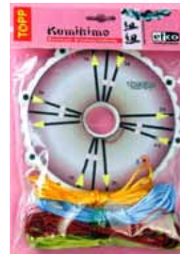
523 002 Flechtscheibe Set VE 1 Inhalt: 1 Scheibe / 2 Schablonen / 6 Satinkordeln à 3m in weiss, rosa, hellgrün, gelb, hellbau und rot / Anleitung