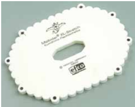
523 000 Flechtscheibe oval VE 1