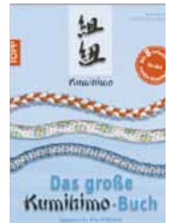
522 996 VE 1 Grosse Kumihimo-Buch 20x26cm, 80 Seiten Hardcover