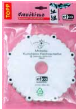
523 001 Flechtscheibe rund VE 2