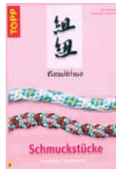
523 003 Buch Kumihimo Schmuckstücke VE 1