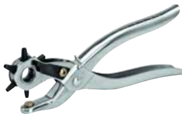
770 015 Lochzange VE 1 Löcher von 2.5 - 4.5mm BL, 2 Jahre Garantie