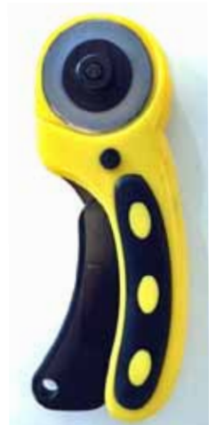
510 001 Rollschneider D.45mm VE 1