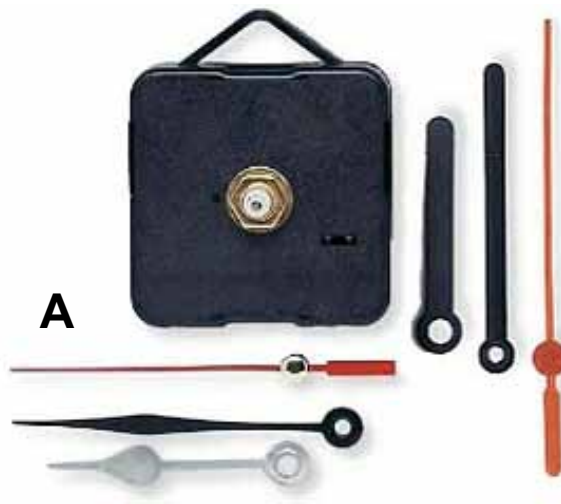
3310 991 Uhrwerk mit 2 Zeigersets VE 1 geeignet für 4mm starke Teile Uhrwerk schwarz Grösse: 5,5x5,5x1,5 cm Zeigerlängen Set A 5 + 7 + 7,3 cm Zeigerlängen Set B 6,2 + 8,3 + 9 cm