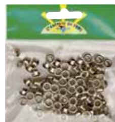
522 014 Ösen D.7cm 100 Stk (f.Zange 522 011) VE 1