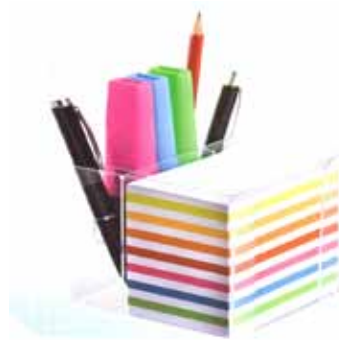
510 526 Notizbox m. Stiftehalter ca. 700 Notizzettel Box = 9.5 x 9.5cm VE 1