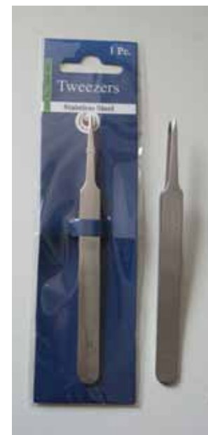
510 088 Pinzette VE 2