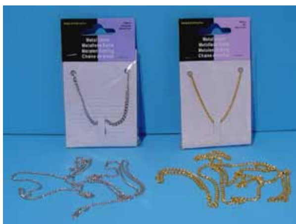
Schmuckkette VE 3 silber 2 mm / 1 Meter 522 311 gold 2 mm / 1 Meter 522 312 silber 3 mm / 1 Meter 522 313 gold 3 mm / 1 Meter 522 314