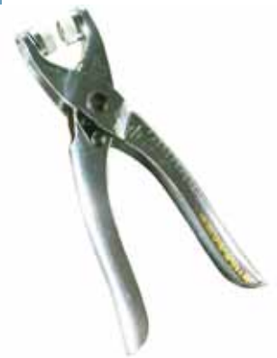
522 012 Druckknopfzange D 9cm, inkl. 50 Knöpfen VE 1