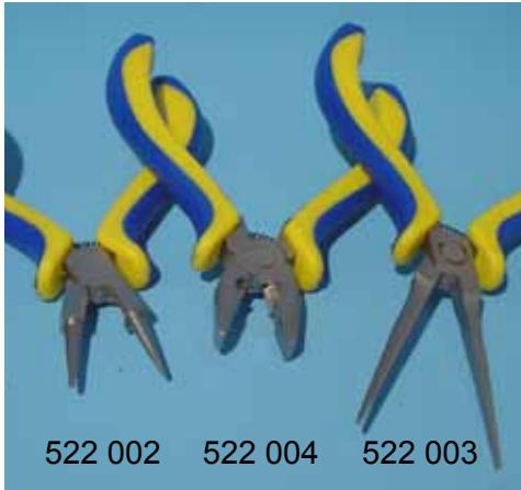
Zangen Kombizange schneiden + drehen VE 2 522 002 Rundzange lang 522 003 Flachzange 522 004