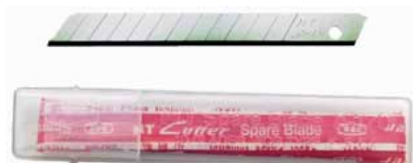
522 099 Ersatzklingen 10 Stk VE 1 aus rostfreiem Stahl Breite 9mm / Länge 80mm günstiger ab VE 20

Cutter mit transparentem Schaft aus Kunststoff, Schieber und Klingenbrecher farbig. Klingenföhrung aus Metall, Klinge mit Schiebermechanik und Klingensperre 'Auto-Lock'. Für Rechts- + Linkshänder geeignet.