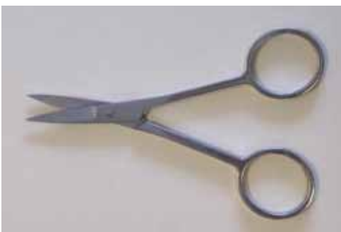
510 083 Spitzschere Edelstahl 10.6cm VE 3