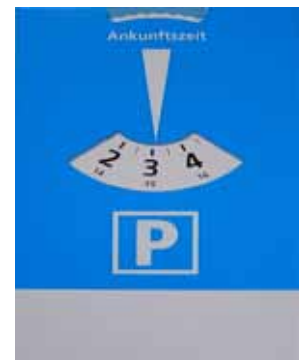
510 190 Parkscheibe VE 5 Karton 11 x 19cm