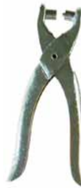
522 011 Ösenzange D 7cm, inkl. 100 Ösen VE 1