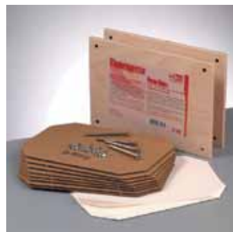
522 105 Blumenpresse 15.5x22.5cm VE 1