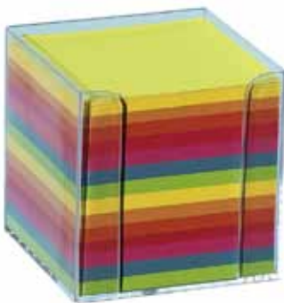
510 525 Notizzettelbox glasklar gefüllt, 9.5 x 9.5cm VE 1