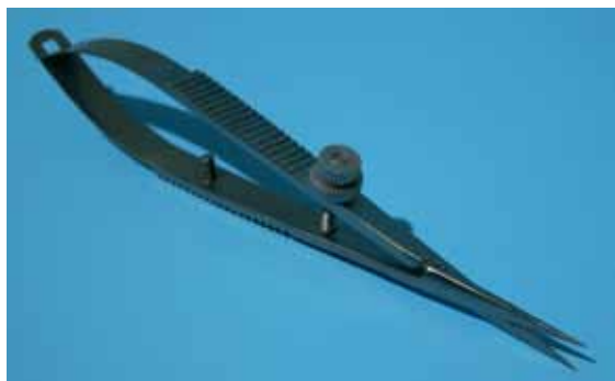
510 089 Präzisionsschere mit Pinzettengriff VE 1