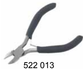
522 013 Seitenschneider VE 1