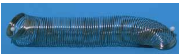
Fingerringspirale VE 5 D 2cm, Beutel à 3 Stk 522 537