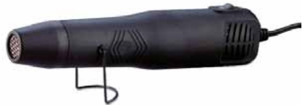
612815 Heissluftföhn /Gebälse 230V speziell für Embossing entwickelt VE 1