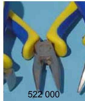
522 000 Rundzange kurz VE 2 ohne Rillen (f. Quetschperlen)