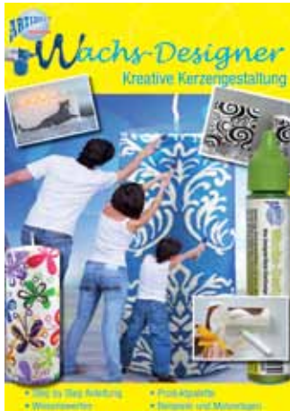
05131 Kerzengestaltung m. Wachsdesigner mit Vorlagen VE 1