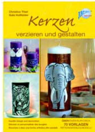
05130 Kerzen verzieren und gestalten 55 Seiten d/f/i/e mit 70 Bildvorlagen VE 1