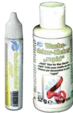
Wachskleber „rapid“ VE 3

80 695 „rapid“ Pen 31g 80 696 „rapid“ 52g