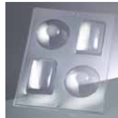
2005 998 rund D.75mm/eckig 80x55mm