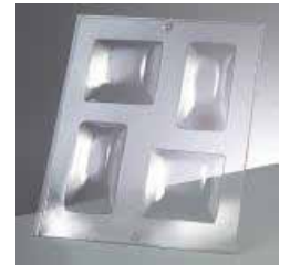
2005 999 quadratisch 70x70/60x40mm

Thema Seife siehe auch HobbyFun Prospekt