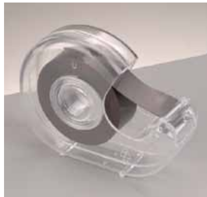
566 900 Magnet-Klebeband 1.8cmx4mx0.3mm VE 1 selbstklebend / SB