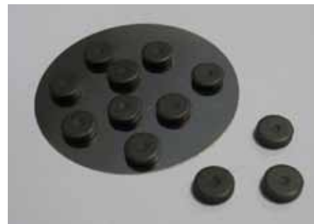
566 980 Magnete VE 3 12x2mm, auf Metallplatte SB à 12 Stück