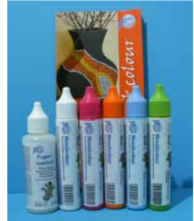
72 376B Set B / Trendfarben weiss/orange/violett-pink/ hellblau/hellgrün