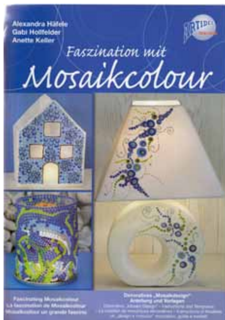
72350B Buch VE 1 mit tollen Vorlagen A4 / 64 Seiten d / f / i / e