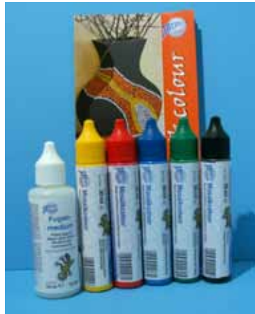
72 376A Set A / Standardfarben gelb/rot/blau/grün/schwarz