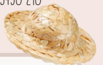
ART-NR. 3450 210