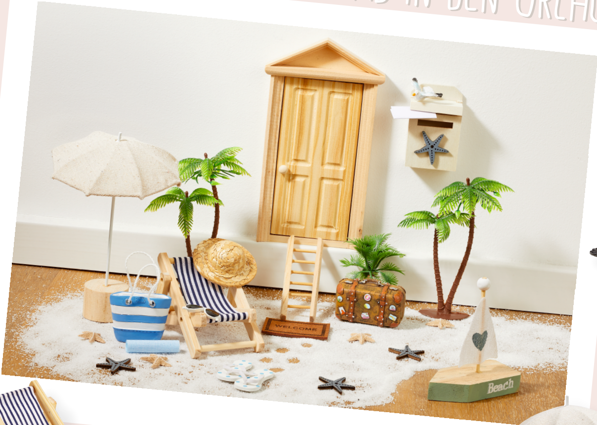
ART-NR. 3870 198