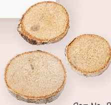
ART-NR. 3275 036