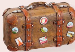
ART-NR. 3870 823