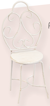
ART-NR. 3473 001