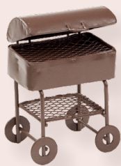
ART-NR. 3473 034