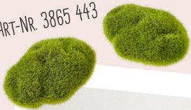
ART-NR. 3865 443