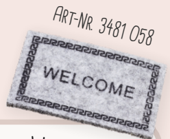
ART-NR. 3481 058