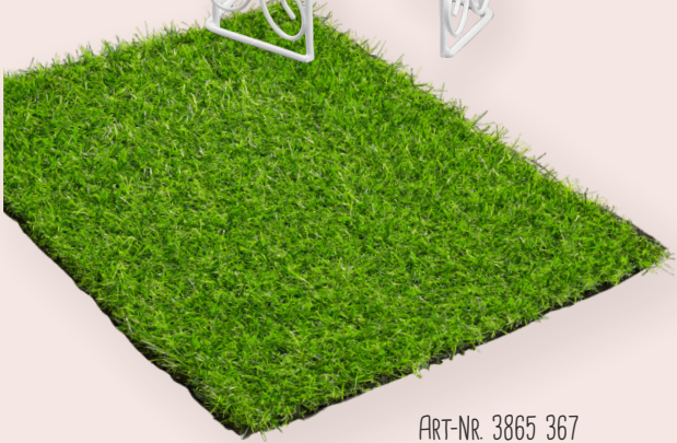
ART-NR. 3865 367