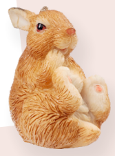
ART-NR. 3870 844