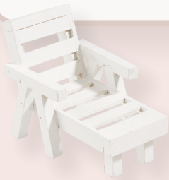
ART-NR. 3270 229