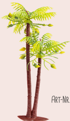
ART-NR. 3865 218