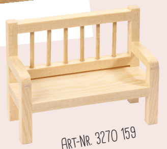
ART-NR. 3270 159