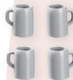
ART-NR. 3451 017