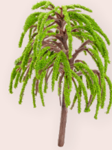
ART-NR. 3865 637