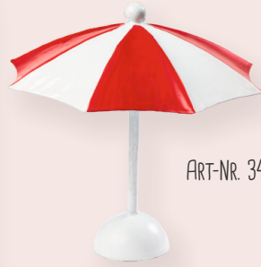
ART-NR. 3473 007

STRANDFEELING FÜR ZUHAUSE - MIT ETWAS SAND UND TOLLEM STRANDZUBEHÖR KÖNNT IHR AUCH VOR EURER WICHELTTÜR DEN SOMMER EINZIEHEN LASSEN UND DEN COUNTDOWN FÜR DEN ANSTEHENDEN FAMILIENURLAUB EINLÄUTEN. DENN AUCH DER WICHEL BRAUCHT MAL FERIEN.