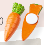
ART-NR. 3870 530