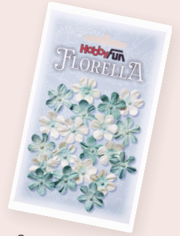
ART-NR. 3866 003