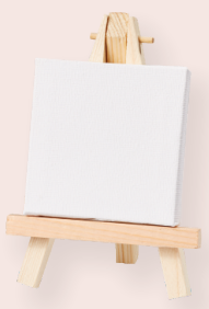
ART-NR. 3270 273