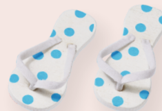
ART-NR. 3860 595