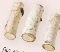
ART-NR. 3275 008