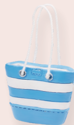
ART-NR. 3871 003