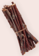
ART-NR. 3275 035