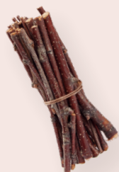
ART-NR. 3275 035

DER SOMMER STEHT VOR DER TÜR UND ES IST ZEIT, DEN GARTEN FÜR DIE ERSTE GRILLPARTY VORZUBEREITEN. DER WICHTEL WAR SCHON FLEIßIG UND KÖNNTE IN EINEM BRIEF DARUM BITTEN, DASS DIE KINDER KLEINERE AUFGABEN IM GARTEN ÜBERNEHMEN. ZUR BELOHNUNG WIRD MIT DER GANZEN FAMILIE GEGRILLT.