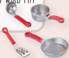
ART-NR. 3481 045