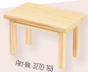
ART-NR. 3270 169