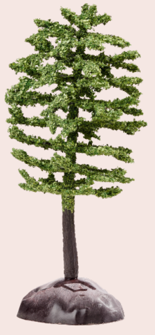
ART-NR. 3865 352