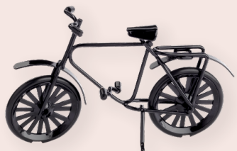
ART-NR. 3470 023

NATÜRLICH MÖCHTE AUCH DER WICHEL SEINEN GEBURTSTAG FEIERN. EIN WENIG BUNTES KONFETTI, KLEINE GESCHENKE UND EIN LECKERES ESSEN - FERTIG IST DIE PARTY-DEKO! DIE KINDER KÖNNTEN EIN BILD MALEN ODER DEN WICHEL MIT ETWAS SELBSTGEBACKENEM ÜBERRASCHEN.