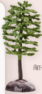
ART-NR. 3865 352

EIN URLAUB MIT DEM WOHNMOBIL ODER DIE NÄCHSTE RADTOUR MIT DER GANZEN FAMILIE STEHEN AN? DANN LASST DOCH EUREN WICHTEL DARAN TEILHABEN. DAS WOHNMOBIL WARTET SCHON UND FAHRRAD UND WANDERRUCKSACK LIEGEN BEREIT. ES KANN ALSO LOSGEHEN UND AUCH DER WICHTEL GENIEßT DIE GEMEINSAME ZEIT.