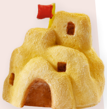
ART-NR. 3870 319