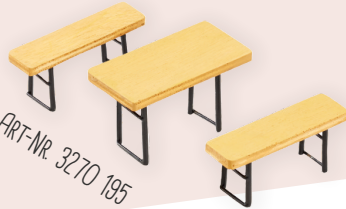
ART-NR. 3270 195