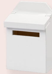
ART-NR. 3481 040