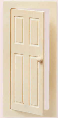
ART-NR. 3481 053