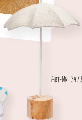
ART-NR. 3473 219