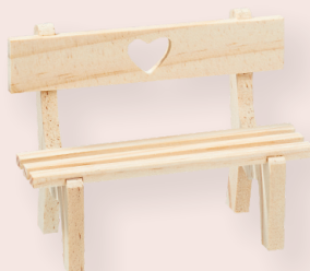
ART-NR. 3270 513