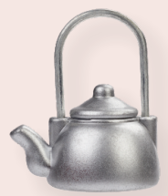
ART-NR. 3481 034