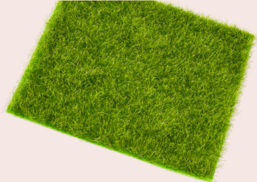
ART-NR. 3865 444