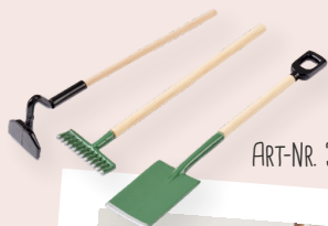
ART-NR. 3481 001