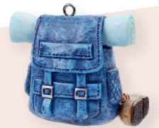
ART-NR. 3871 049