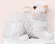
ART-NR. 3870 843