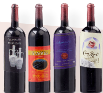
ART-NR. 3481 010