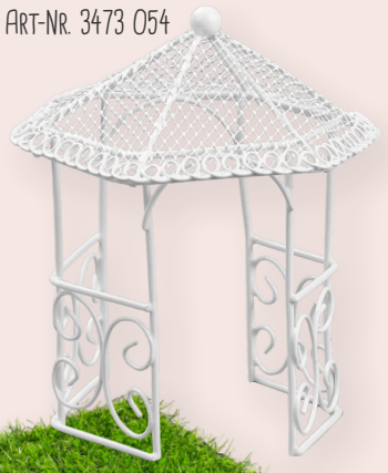
ART-NR. 3473 054