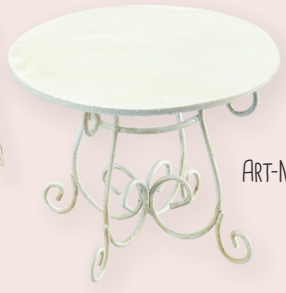
ART-NR. 3473 002