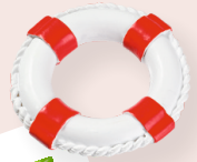
ART-NR. 3870 253