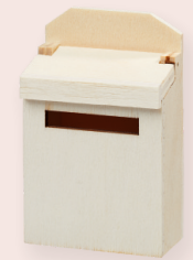
ART-NR. 3481 039