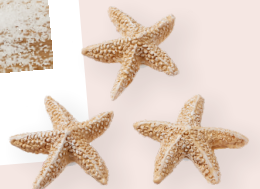
ART-NR. 3870 664