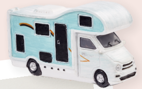
ART-NR. 3870 975