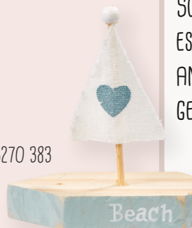
ART-NR. 3270 383

EIN ERHOLSAMER SOMMERURLAUB DARF BEIM WICHTEL SELBSTVERSTÄNDLICH AUCH NICHT FEHLEN! SONNENBRILLE, FLIP-FLOPS UND SONNENHUT - DER KOFFER IST GEPACKT UND ES KANN LOSGEHEN. EIN PAAR SCHÖNE TAGE AM STRAND UND DER WICHTEL VERREIST GEMEINSAM MIT DER GANZEN FAMILIE.