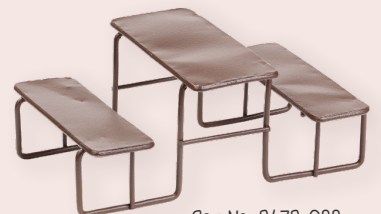
ART-NR. 3473 022