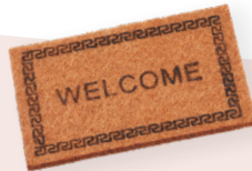
ART-NR. 3481 016