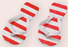
ART-NR. 3860 593