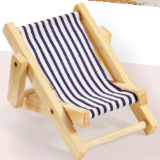
ART-NR. 3270 134