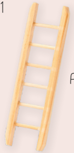
ART-NR. 3270 166