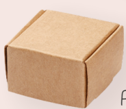
ART-NR. 3481 038