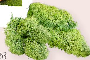
ART-NR. 3865 358