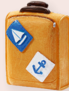
ART-NR. 3870 318