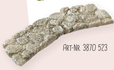
ART-NR. 3870 523