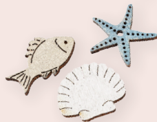
ART-NR. 3863 163