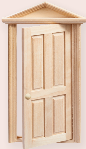
ART-NR. 3481 057