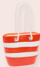
ART-NR. 3871 004