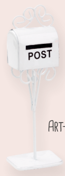
ART-NR. 3473 041