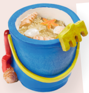
ART-NR. 3870 321