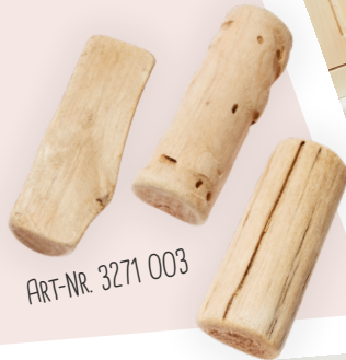
ART-NR. 3271 003