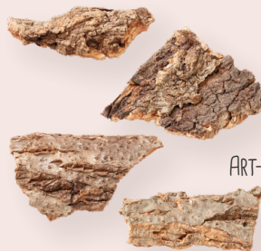
ART-NR. 3865 658