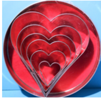
524 046 Herzen , 6-teilig