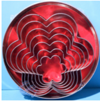
524 045 Blumen , 7-teilig